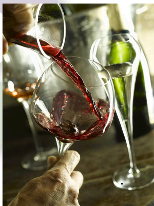
A consommer avec modération. L'abus d'alcool est dangereux pour la santé.

• Victoria Newman - 01 45 25 73 36 vnewman@museedevinparis.com